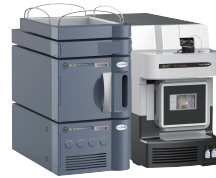
ACQUITY UPLC I-Class PLUS / Xevo TQ-S cronos System