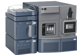
ACQUITY UPLC I-Class PLUS / Xevo TQ-Loong System